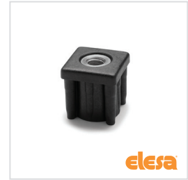
ELESA original design NDX.0